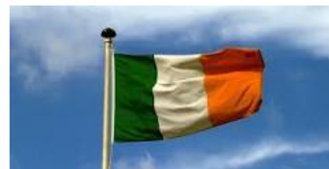
Irland – die katholische grüne Insel

Reisedokumente: Reisepass oder Personalausweis