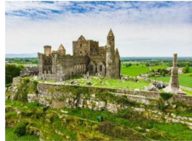
Rock of Cashel – Heiliger Patrik

6 .u.7.Tag. Rückfahrt über Großbritannien zur Fähre nach Rotterdam und Weiterfahrt mit dem Bus nach Jena